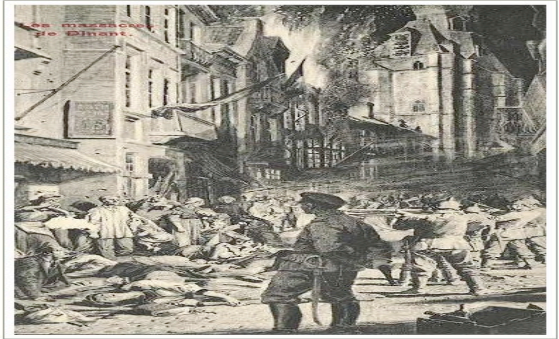
Figure A.2: Post-war postcard