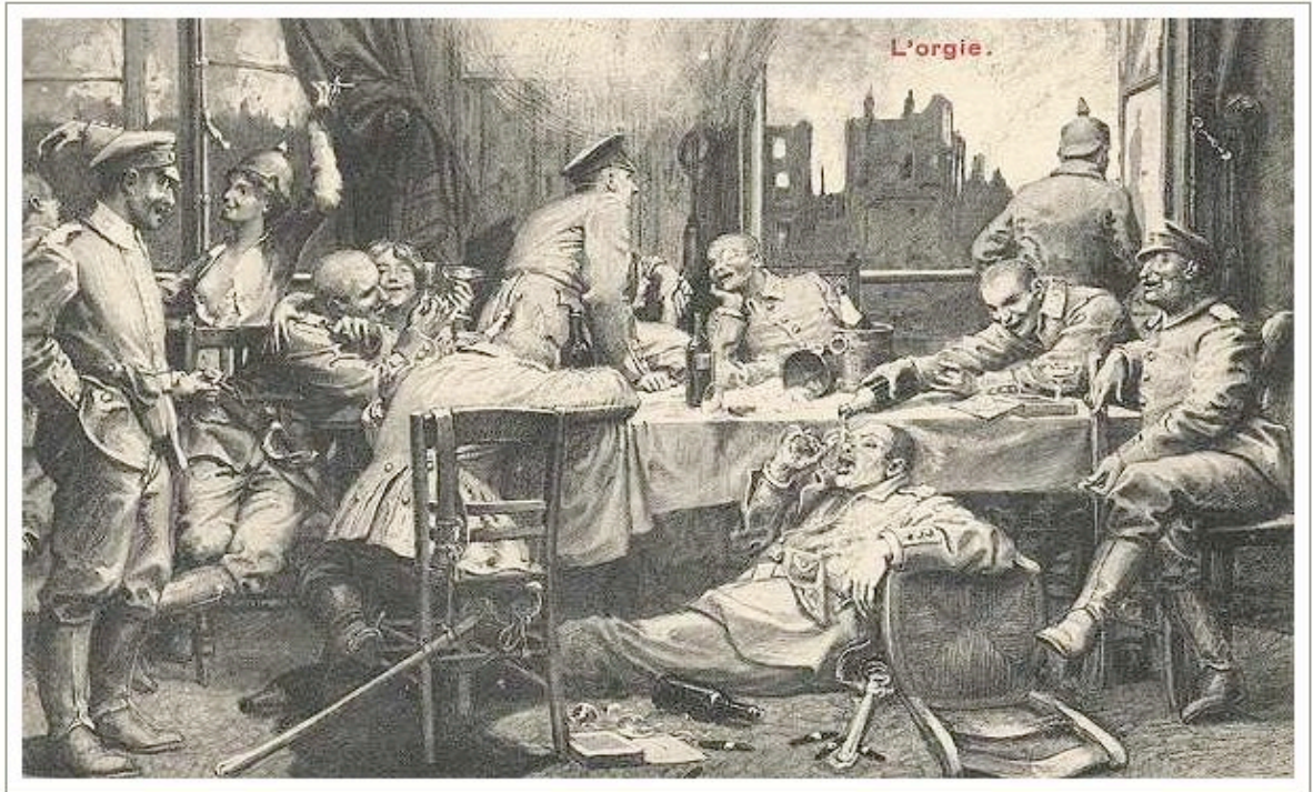
Figure A.4: Post-war postcard