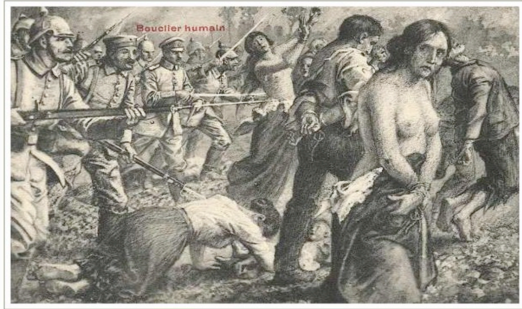
Figure A.1: Post-war postcard