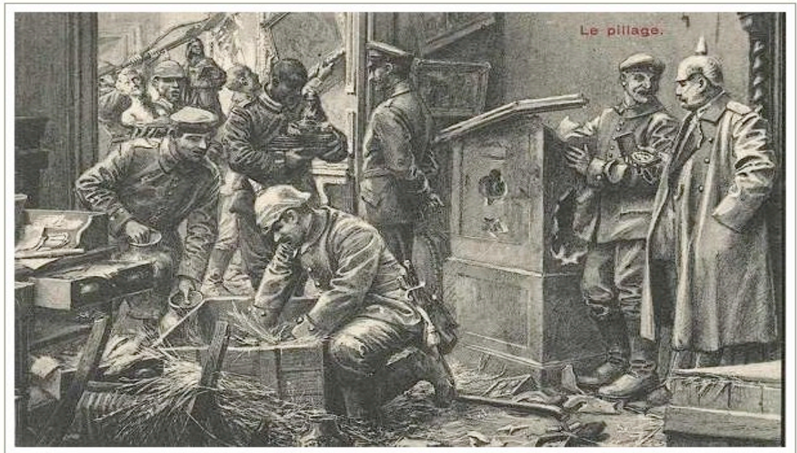
Figure A.3: Post-war postcard